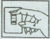
Turn wall switch OFF Apague el switch de la pared