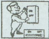
Switch main power OFF Apague el switch principal de la caja